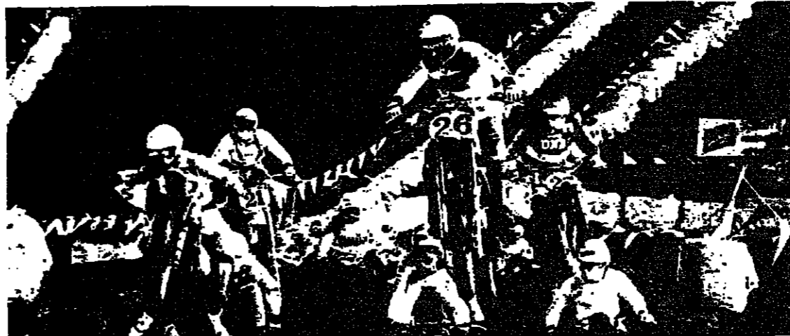
المقبرة الخطرة فوق تلة (التويوتا)

خيارات أمام المتسابقين النصر أو المستشفى